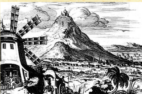
Grabados del siglo XIX que representan la ciudad de Potosí.

Por su parte, la ciudad de Córdoba tenía una importante producción de textiles. Los tejidos cordobeses se vendían en Potosí, y también en Asunción y Santa Fe. Pero su especialidad eran la cría y comercialización de mulas, que vendía muy bien al Alto Perú. Allí cambiaba las mulas por metálico; a su vez, con el metálico pagaba, en el puerto de Buenos Aires, productos importados, que luego los comerciantes cordobeses vendían en distintos territorios. A principios del siglo XVII, Córdoba era un importante centro distribuidor de esclavos y productos europeos, en general adquiridos en Buenos Aires, que circulaban hacia Potosí y también hacia las regiones cercanas y Chile.