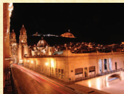
Foto actual de la ciudad de Zacatecas.

Se fundó en 1546, luego de varios años de luchas cruentas entre los pobladores originales y los conquistadores españoles. Su fundador, el capitán Juan de Tolosa, la bautizó como Ciudad de Nuestra Señora de Zacatecas. La ciudad se vinculaba con uno de los centros mineros más importantes del territorio colonial español. Su función principal era proveer de insumos y herramientas a las minas de plata. De esta manera, conformó un circuito económico del que la Corona española recibió grandes cantidades de plata. En el año 1993, fue declarada Patrimonio Cultural de la Humanidad.