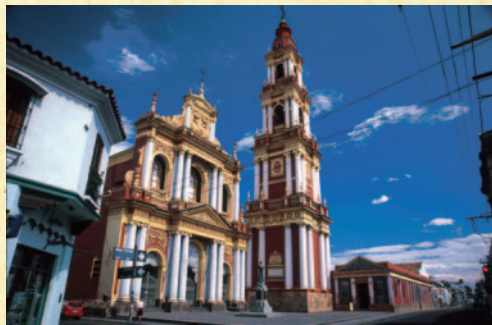
Foto actual de la ciudad de Salta.

La ciudad de Salta se fundó en 1583. Las sublevaciones indígenas ante el avance de los conquistadores por su territorio y las duras peleas de los españoles por adueñarse del espacio hicieron que el virrey del Perú, Francisco Toledo, diera instrucciones para controlar la región y buscar vías de comunicación con el Río de la Plata. Para cumplir con esas instrucciones, Hernando de Lerma fundó la ciudad de Salta. Para ello eligió localizarla en un valle, hoy llamado Valle de Lerma, en el norte de nuestro territorio. Para los españoles, la ciudad fue un punto muy importante para asegurar la ruta entre el Alto Perú y el Río de la Plata.