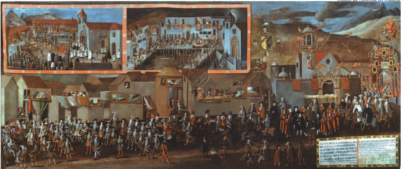
Melchor Pérez Holguín, Entrada del Virrey en Potosí.